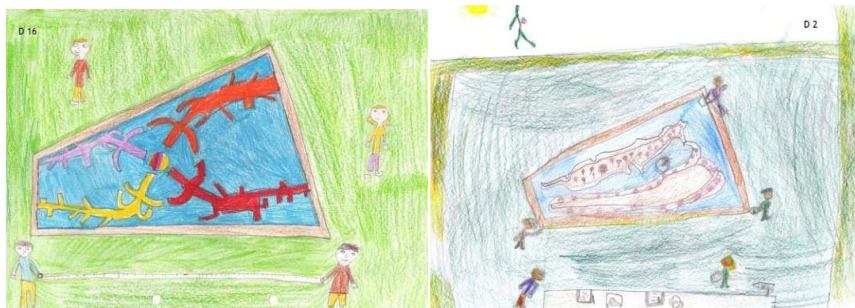
Figuras 7 e 8 – Desenhos sobre a atividade de medição do jardim Alagado

A realização de estimativas foi um processo alvo de diferentes procedimentos. Um dos grupos utilizou a estratégia de observação da planta do Jardim do Paço, inferindo-se, a partir das respostas e das notas de campo, que estimaram os comprimentos reais a partir das diferenças relativas na planta (figura 9). Note-se que estes alunos antes de realizar qualquer estimativa, mediram os comprimentos de dois lados do quadrilátero, depreendendo-se que partindo do referencial do valor dos lados medidos, por comparação, estimaram os comprimentos pedidos.