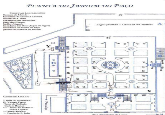
Figura 3 – Representação do itinerário seguido por um dos grupos no Jardim do Paço

imediate e tenha sido alvo de discussão nos grupos, todos conseguiram identificar o local referido como sendo o Jardim Alagado. Para além disso, assinalaram corretamente na planta do Jardim o percurso para aí chegarem. Na figura 3, pode observar-se o itinerário seguido por um dos grupos na visita.