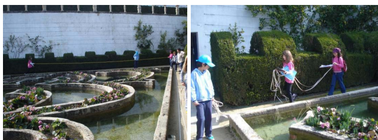
Figuras 4 e 5 – Medição dos lados do Jardim Alagado

Foi notório o envolvimento de todos os elementos dos grupos na realização desta tarefa. Nas figuras 4 e 5, observa-se um grupo a medir um dos lados do Jardim Alagado e a transportar a fita de decâmetro.