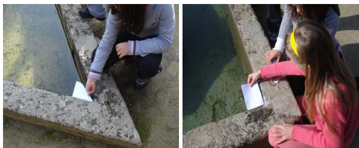
Figura 11 e 12 – Processo seguido para a classificação dos ângulos do Jardim Alagado

Quanto à classificação dos ângulos, reproduzindo estratégias já utilizadas em sala de aula, algumas das crianças utilizaram a folha branca simples dobrada em quatro. Note-se que num dos grupos, alguns dos alunos classificaram os ângulos por simples observação, ainda que um dos alunos confirmasse por recurso à folha A4. Sem dificuldades, todos os grupos identificaram e classificaram os quatro ângulos no Jardim Alagado. Nas figuras 11 e 12, evidencia-se a estratégia usada para a classificação dos ângulos em reto e agudo, respetivamente, e na figura 13 apresenta-se a explicação de um dos alunos.